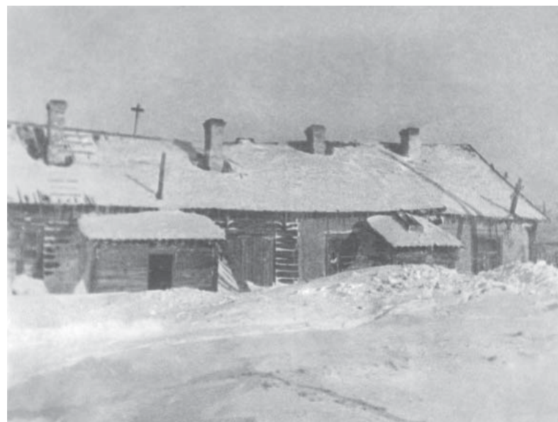
6. Барак ВГС (стр. 402)