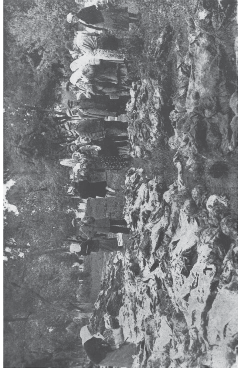
1. Расстрелянные в Виннице (стр. 17)

Как великолепно оправдалась злодейская затея Архипелага!